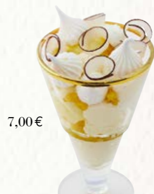
Piña Colada Glacée

Noix de Coco, Ananas, Sirop de Piña Colada meringue, chantilly